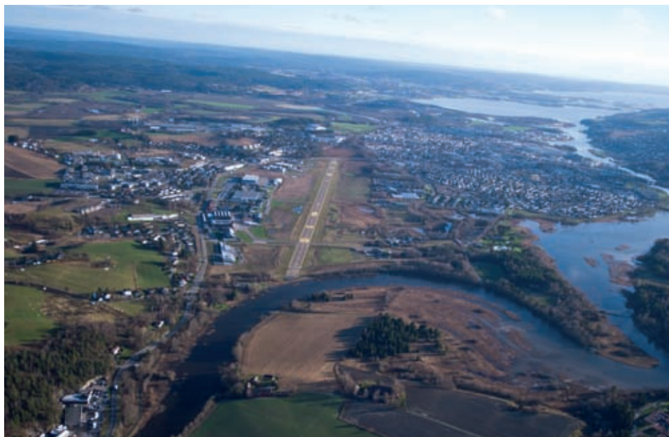
Kjeller er Norges viktigste luftsportsanlegg målt i antall aktive utøvere på helårsbasis. Flyplassen har fylt 102 år og er en av verdens eldste i fortsatt drift. Forsvaret bruker Kjeller til tyngre vedlikehold av F-16 gjennom statsforetaket AIM Norway. Skedsmo kommune har i utkast til kommuneplan foreslått at flyplassen skal brukes til bolig og næring.