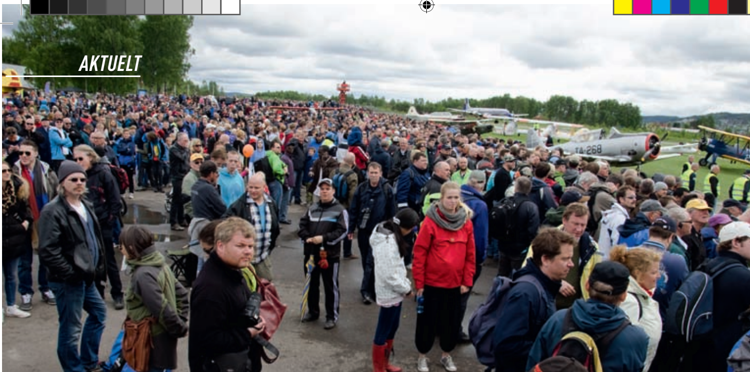
Flydagen Kjeller samler årlig mellom 10 000 og 15 000 besøkende som lar seg fascinere av flyging og luftfartshistorie.