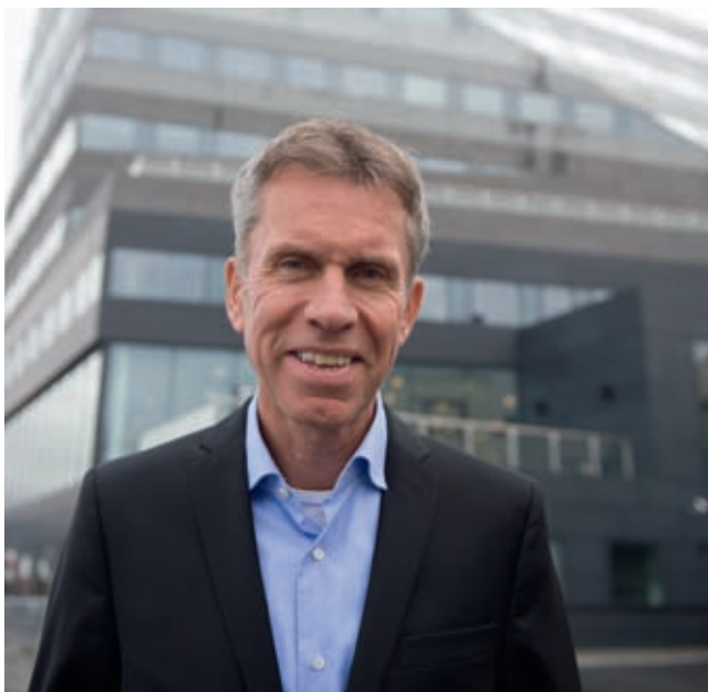
– Flysikkerheten er en ting, men som tilsynsmyndighet har vi også et ansvar for at andre sider av samfunnsnyttan av en flyplass blir synliggjort, sier Luftfartsdirektør Stein Erik Nodeland til Flynytt.